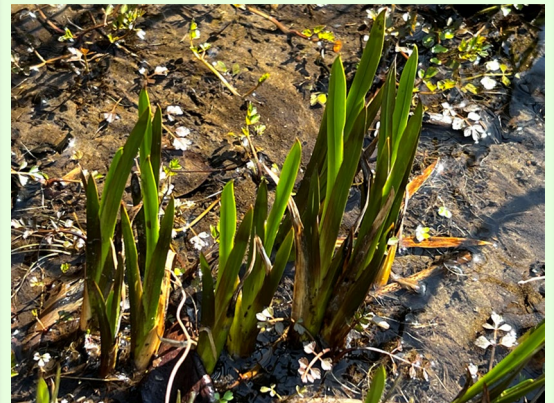
ショウブ<菖蒲>ショウブ科ショウブ属

湖沼、河などに生える多年草の草本で、単子葉植物の一種で全体に芳香がある。花はめだたないが端午の節句に茎葉をお風呂に入れてショウブ湯として使う習わしがある。ショウブ湯は健康で丈夫になると言われている。又、武士道の「勝負」にもかけられる。