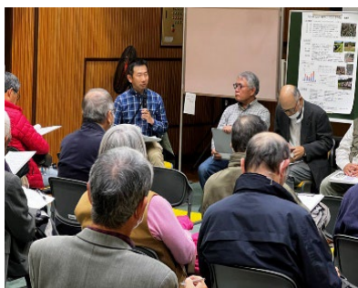
ポスターセッションを終えて

将来も見据えた里山活動の関わり方への提起になる里山カレッジを目指して、これからも取り組んでいく予定です。