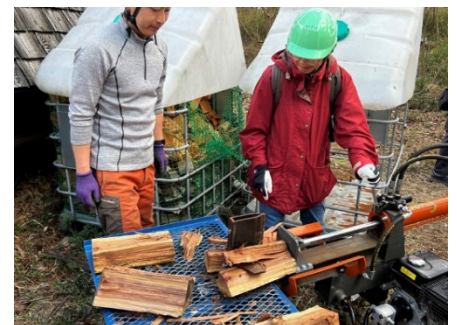
薪割り機と背後は薪保管コンテナ

今回のカレッジ受講生の中で里山活動を行っているのはどの程度なのか?アンケートから28人中20人が里山活動に参加していることが明らかとなりました。県内の里山団体に加入する若い世代の人が増え、その人たちがこのようなカレッジに関心を持っていることは、今後の里山活動の展開への新たな風を予感させるものでした。