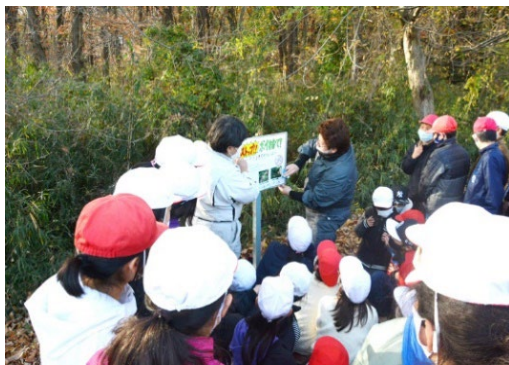
守ろう里山プロジェクト

活動の拠点である千葉県流山市市野谷の森は50haほどの森でした。しかし、TX開通による周辺開発のため、ほぼ全部が伐採される計画がもちあがりました。そこで地元のいくつかの自然保護団体が保全運動を開始、