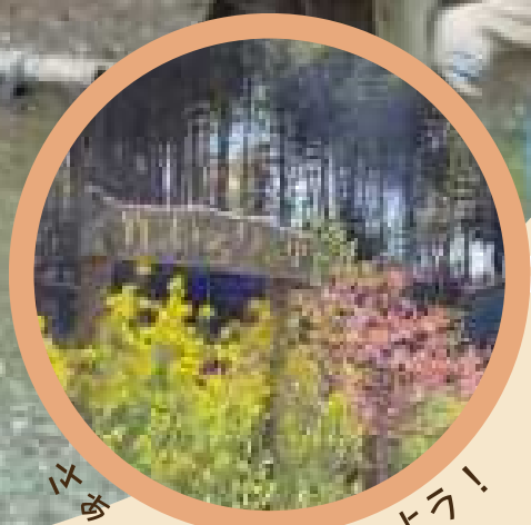
竹、里山に出掛けよう！