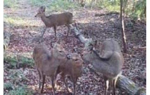
シカの毛づくろい