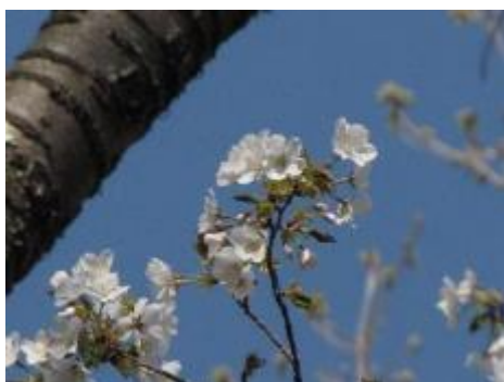
青空に桜が映える