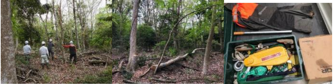
チルホールで牽引しながら

広葉樹は、針葉樹のように幹が必ずしもまっすぐではないため、樹形のバランスを確認しながら伐倒方向を見極めることが重要だと思います。かかり木を避けるなど倒したい方向へ伐倒することが難しい場合は、チルホールを使用し、工夫しながら作業しました。腐朽し、もろくなった木を倒す場合、伐倒木が地面に衝突すると幹や太い枝などが碎け散ることがあるため、周辺の作業者も十分に対象木から距離をとることも重要だと思います。