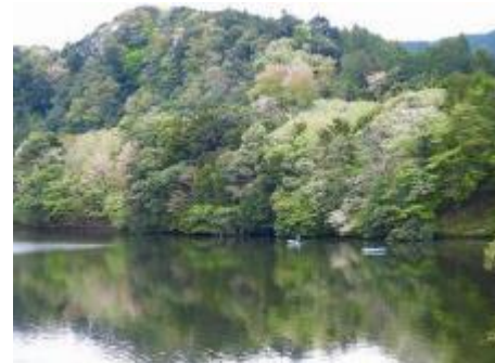
新緑の豊英島-ホテイ岬

年度初めの活動日ということで、午前中に定時総会を開催しました。総会では 2021 年度の活動報告と決算報告、監査結果、2022 年度の活動計画と予算案について話し合われました。今年度の活動計画は次頁のとおりですが、いろいろな新しいことに積極的にチャレンジしていくことを確認しました。