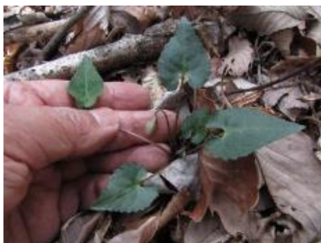
種をつけたヒナスミレ

清和県民の森の管理事務所の周りは、植栽したミツバツツジが満開となり、落葉樹の山は芽吹き始めたところでした。島に入って目についたのは、フモトスミレとフデリンドウです。そこらじゅうと言って良いほど林床で花を咲かせていました。時期が異なるので去年までと比較するのは難しいですが、台風やナラ枯れ被害により林床が明るくなったために増えているのかもしれませんが。また、日が当たる明るい林床を、早春の蝶ミヤマセセリがひらひらと飛び回っていました。