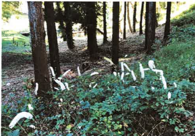
森の妖精 (上) 2020年10月25日 アグリパークで