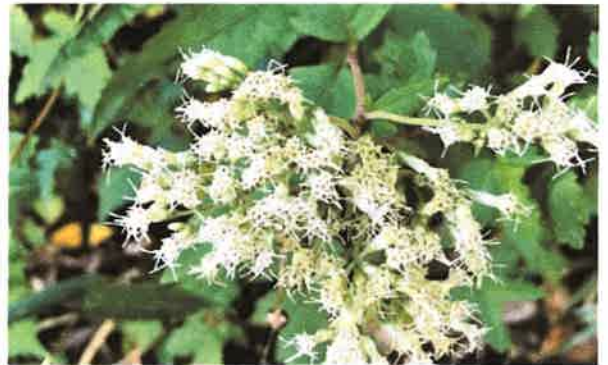
アグリパークで撮影、2020年10月25日