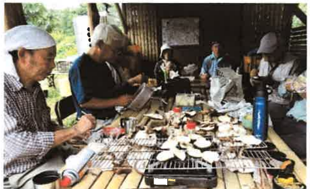
椎茸BBQ 2013年10月 (上) 小田原城 2015年6月14日 (下)