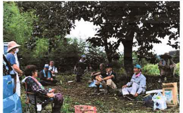
話の輪が広がる休憩時間

9月13日 花の回廊 自由参加 12名 取香川堤防 桜の小公園 草刈り 取香川堤防 桜の小公園共に夏場の2ヶ月間で想定以上に草が成長がはやく、草刈りにが一苦労。 この時期は毎年草との戦いの季節です。