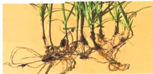
ハマスゲ 根と塊茎