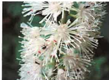
カラシナショウマ 花拡大写真 (右)

*新しい山野草に出会い感動、これから、もっと観察眼を高め新種 (私個人の) 発見を目標に里山活動を続けたい。