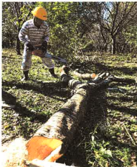
サクラ間伐 アグリパーク 2020年 10月25日

10月25日 アグリパーク 自由参加 12名 菜の花 種まき 草刈り サクラ間伐