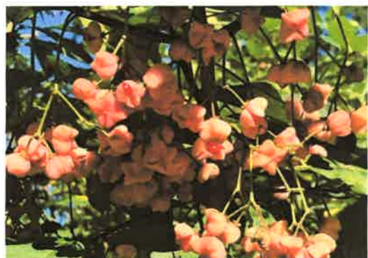
アグリパーク 2020年 10月25日