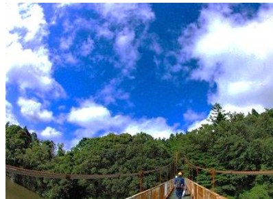
青空に白い雲が輝いて