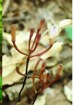
トサノクロムヨウラン