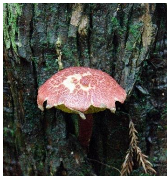
コガネキクバナイグチ