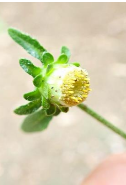
サジガンクビソウ