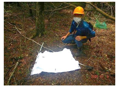
1年ぶりのマダニ採集