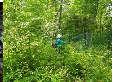
コナラ伐採地の相対照度調査

調査は、10:20~10:50、相対照度の測定には、照度計8台、トランシーバ4台を使用し、調査人員は全員参加の11名です。測定箇所は、コナラ伐採地が20地点(A-1~D-5)と、千年広場、コナラ更新林の苗畑とヒメコマツ植栽地、岬のヒメコマツ植栽地の計24地点です。相対照度は、開けた場所(橋の上)の照度を100%とした時の、各地点の照度の比率(%)であり、トランシーバで連絡を取り合いながら、各地点で同時に照度を測定しました。なお、相対照度はバラツキが大きいので、各地点で5回の測定を行い、その平均値を各地点の相対照度としました。