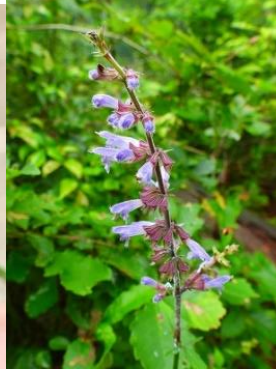
アキノタムラソウ