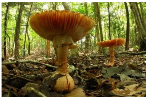
カブラテングタケ

午前中は森の照度調査。定点観測に何年か参加しているだけで、森に差し込む光がどんどんかわっていくのが分かって勉強になります。その後は森の中の散策。森の中はキノコが沢山！大きなアカヤマドリ、綺麗なコガネキクバナイグチなど、久しぶりに豊英島らしいキノコに出会えて嬉しかったです。