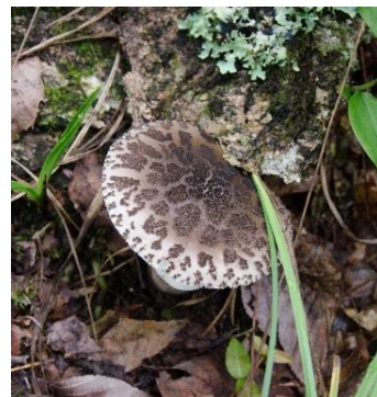
ヘビキノコモドキ