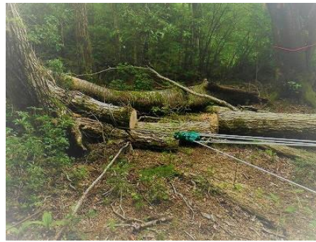
滑車を使って倒木処理