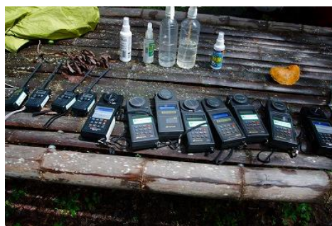
相対照度測定機材一式

天気予報では大雨が心配されましたが、急速に天気が回復し、予定どおり調査を行うことができました。雲の動きが早く、時々日が射す状況となり、照度が安定せず相対照度調査には難しい条件でした。