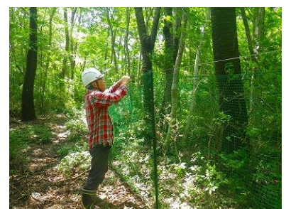
植生保護柵の補修

それらは一旦補修しましたが、被災後時間がたってからの倒木、落下枝などの影響で支柱が折れ曲がるなどあちこちが傷み、シカの侵入を許して柵内の植生が著しい被害を受けた場所もありました。活動を再開した先月と今月ですべての植生保護柵を再確認し、必要な補修を行いました。（鶴沢）