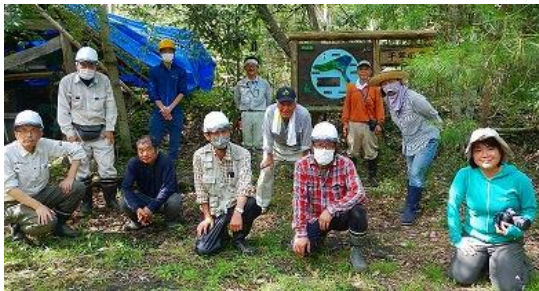
千年の森もソーシャルディスタンス

島から帰る時、「アー今日はよく働いた」と何方かが満足気につぶやく声が聞こえました。吊り橋の上空には久し振りに見る青空に白い雲が輝いていました。