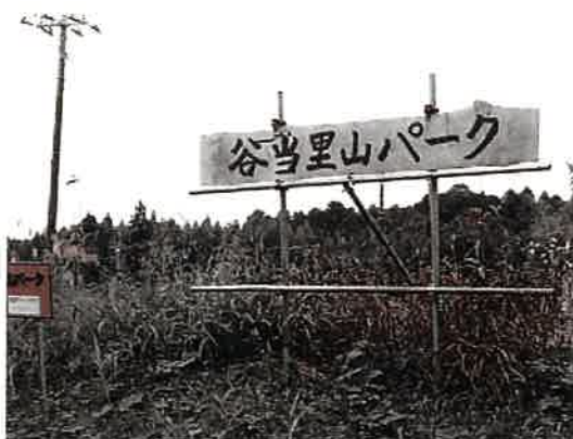
目に入りづらいかもしれませんが 駐車場には、こんな看板が立っています