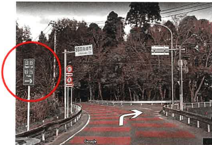
<千城市（千城台）方面から>