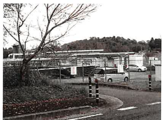
集合場所(駐車場)向かいの千葉市塵芥汚水処理場 千葉市若葉区谷当町630 (周辺目印として)