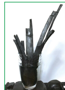
加湿グッズ (ガラス容器)