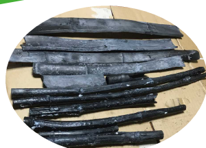
上半分は *CNF 塗布 (白い) 下部群は塗布無し (黒います)

ワークショップの詳細は http://foorestsavor.com/ 及び http://Bell-Lin.jp/ でご紹介しますのでご覧ください。