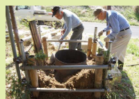
装置移設のために分解中