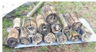
麻紐で括った、炭焼き用炭材 (たんざい)