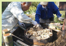
炭材 (たんざい) をドラム缶に詰め込む