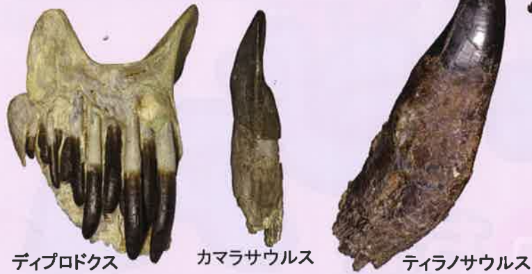
ディプロドクス カマラサウルス ティラノサウルス (所蔵：すべてミュージアムパーク茨城県自然博物館)