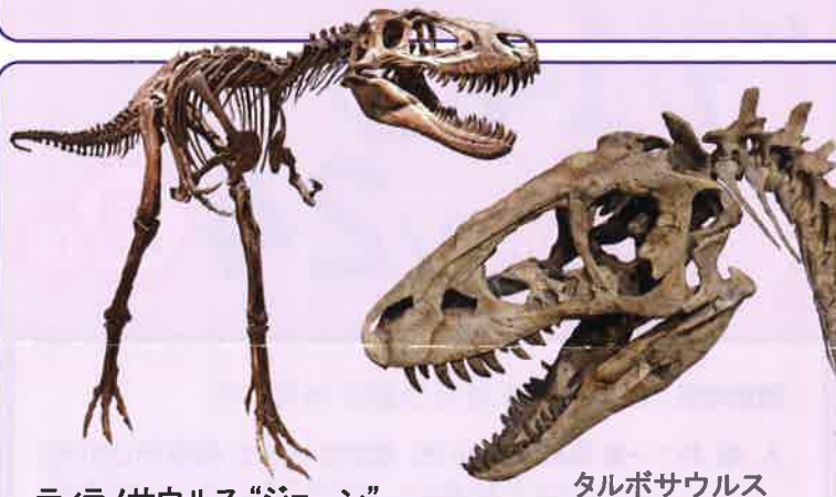
ティラノサウルス“ジェーン” (所蔵：パレオサイエンス)