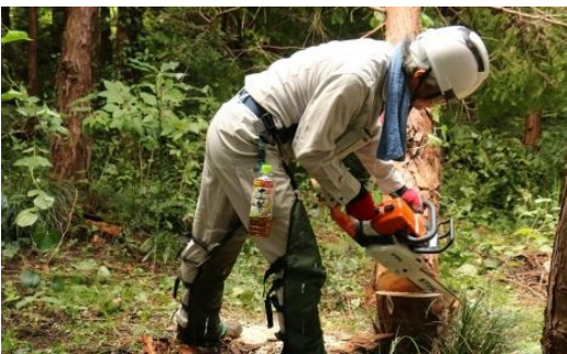
9月9日 チェーンソーを取扱う際の服装や装備について点検した後、「受け口」「追口」「伐倒」の手順を確認しました。さらにロープやフェリングレバー・楔(くさび)の活用を実習。