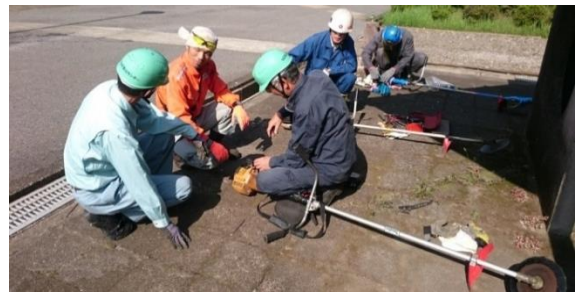
9月3日 刈払機取扱作業について、整備の仕方、リスクアセスメントを含む振動障害に関する知識、法令や実技などを含む 6 時間の研修。修了者には刈払機取扱作業安全衛生教育修了証を交付。