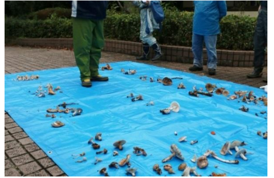
採取したさまざまな形や色のキノコ

ノボリリュウ、アセタケ、ホコリタケの一種、クサウラベニタケ、ガンタケ、ドクツルタケ、ヒヨコタケ、サクラタケモドキ、シラホウキタケなどが採取できました。採取できたキノコのうち同定できたのは1割くらいでした。残りは“〇〇属”、“〇〇の一種”という区分になり、キノコの同定の難しさが改めて明らかになりました。