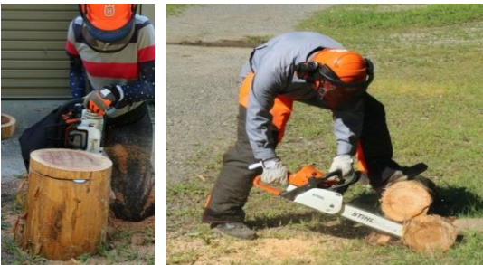
8月5日 チェーンソーの取扱に関し、「段取り八分」「山を甘く見ない」「見込み作業をしない」など作業の基本をベースに、玉切り・水平切りやメンテナンスなどを実習。