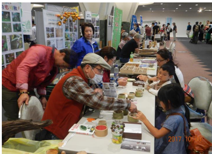
いいなあ～(T_T) 僕も作りたいなあ～

ちば里山センターのブースでは、パネル展示、里山相談の受付ほか、安全講習会、フォローアップ研修の催事チラシの配布を行い、里山活動への理解や協力を呼びかけ参加募集を行いました。