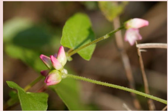
ママコノシリヌグイ タデ科イヌタデ属

「継子の尻拭い」とは誰が命名したのか、凄まじい名前である。この草の棘だらけの茎や葉で憎い継子の尻を吹くという意味である。何とも怖い継母であることが。韓国では「嫁の尻拭き草」と呼ばれる。名前が日本に伝わる過程でだんだんと激しくなったのでしょうか？