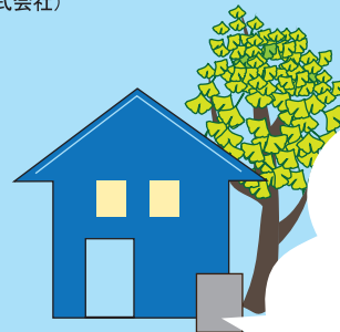
家庭用燃料電池 エネファーム