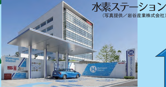
水素ステーション