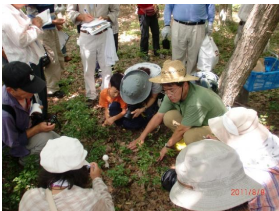
夏のきのこ観察会