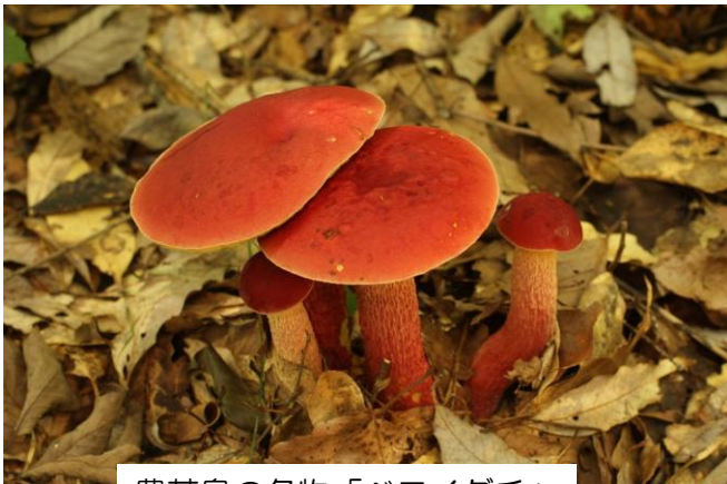
豊英島の名物「ベニイグチ」