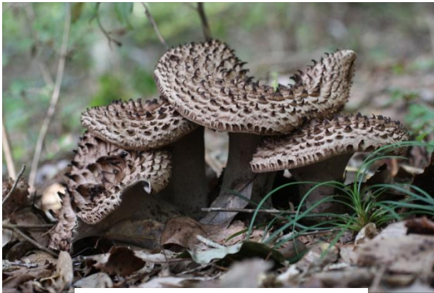
豊英島秋の名物「コウタケ」