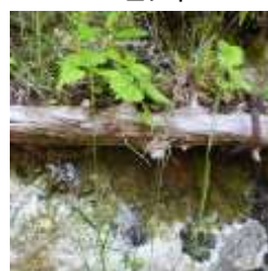
丸太を使った法面緑化