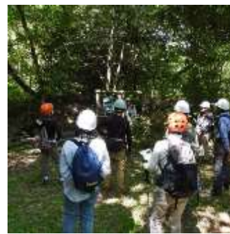
千年広場で島の説明