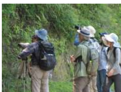
ケイワタバコなど崖地の植生を観察