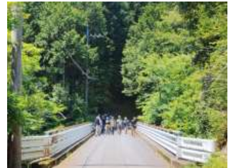
初夏の県民の森をハイキング

伐採と再生の繰り返しで自然はダイナミックに変化して動植物など生物の多様性が保たれていましたが、林業が衰退した今は山が単調化しているのは否めません。近頃の山ではフキが取れないので、今回のフキは休耕農地やその周辺の土手で採集したものと思います。（坂本）