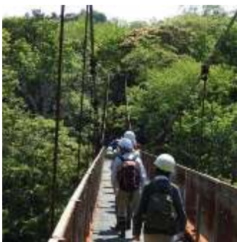
橋を渡って豊英島へ

散策の準備をしている時にヤマビルを心配されていた方がいらっしゃいましたが、残念ながら今回もヤマビルに出会うことはできませんでした。(福島)