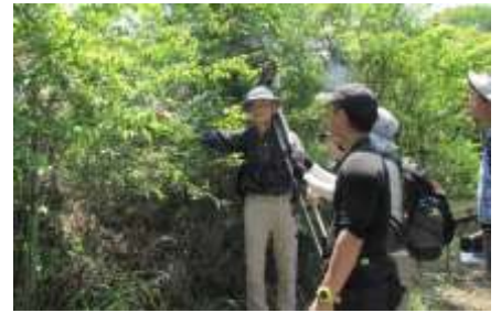
解説を聞きながらのハイキング