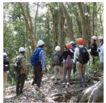
豊英島の森を案内