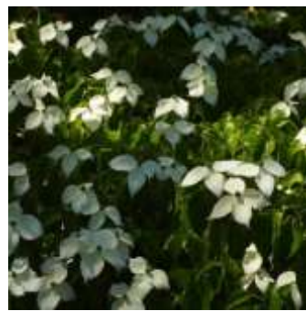
橋の下にはヤマボウシが満開