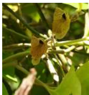
オオバウマノスズクサ