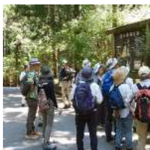
地図を使って見どころ案内

モウセンゴケが自生する一帯は民有地ですが、地主さんが丁寧に草刈りしてくれるので毎年見られます。急斜面を含む広範囲の草刈りは、刈り払い機を使っても重労働でしょう。手抜きをして除草剤でも使えば貴重な植物が真っ先に犠牲になると思います。どなたかが、「この農家さんのお陰でモウセンゴケが守られている」と言われましたがその通りです。ここの地主さんは、山の仕事で親子2世代にわたって付き合いのあった方です。今は3代目が管理しているのかも知りませんが、几帳面な仕事のDNAは引き継がれている様です。(坂本)