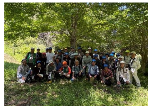
カツラの下で集合写真

参加者は県内各地から16団体、30名に及びました。それぞれ地域や日常の活動が異なるため、問題意識も質問内容も異なりましたが、貴重な学びの場、情報交換の機会として前向きに取り組み、多くのヒントを得て帰路につきました。