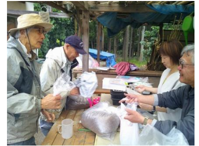
配布するために、希望者ごとに種や培土を分けます

また、今年もエコメッセで苗木の配布を予定しています。里山センターまで事前に届けていただく必要がありますが、ご協力いただくとありがたいです。ちなみに、エコメッセで苗木を持ち帰ってくれる方は庭に植えてみたいという方が多く、どちらかというと大木にならない樹種が好まれるようです。