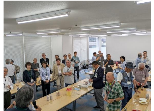
昨年の総会・懇親会の様子