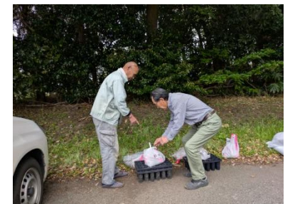
希望者ごとに種などを説明しながら配ります