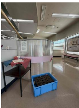
播種したコンテナ容器 （千葉興業銀行君津支店）

このほか、昨年度から千葉興業銀行がコンテナ容器を使って本店および支店の店内で千葉県由来の広葉樹苗木の育成に取り組んでいて、ちば里山センターで協力、支援しています。昨年度は本店と5支店でクヌギやコナラなどの苗を育てていただき、このため、このプロジェクトで集めた種の一部をコンテナ容器への播種も行いました。本年度はさらにあらたに7支店を追加して12支店で苗木の育成に取り組んでくれるとのことでした。