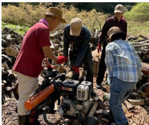
薪割り機を使って

薪の原木となるのは、いすみ市周辺の住民からの依頼により伐採した里山の樹木だ。薪ストーブに向いているのは、火持ちの良いカシ、ナラ、ケヤキなどの広葉樹で、依頼があると、参加できるメンバーがチェーンソーやウインチなどを持参して現地に赴く。道具を持って