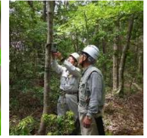
カメラのデータ回収

トビの抱卵を久しぶりに見る事ができました。巣の中で身動きもせず、鋭い眼光でカメラを見ているトビに優しさのようなものを感じました。しばらくして、他の会員がトビを観察しているときに突然飛び去ってしまったようです。近づき過ぎたのでしょうか。その巣には2個の卵が在りました。この後の活動は、トビの抱卵を邪魔しないように巣を遠巻きにした活動となりました。孵化は抱卵後30日ほどだそうです。次回の活動日にはひな鳥が確認できるかもしれません。ひな鳥を見たいと思いますが子育ての邪魔とならないよう注意することが肝要です。(秋元)