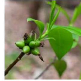
コショウノキの実