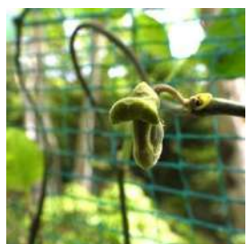
オオバウマノスズクサ