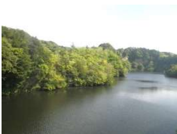
吊り橋を渡って島へ

総会の方は無事におわり、総会後には全員で島内の散策を楽しみました。今年もユウシュンランが咲いているかな？と皆さんソワソワしているので、まずは全員でユウシュンラン探しに出かけてみました。昨年10株ほど見つかったのに、とうとう今年は見つけれませんでした。残念！