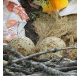
巣の中に 2 個の卵