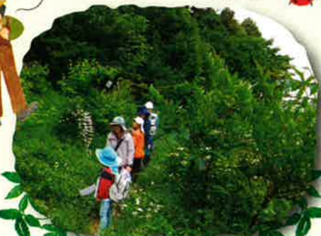
緑の道をワクワク散歩 虫眼鏡持参してもいいね