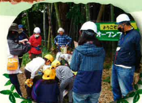
オープンフォレストはじまるよ！