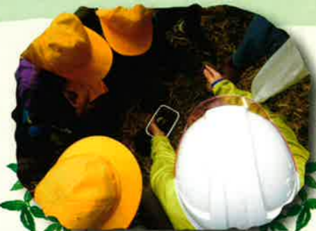
なにかをハクケン！虫かな...？