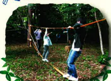
スラックラインって意外とおもしろいよね！笑