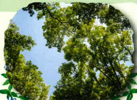
森からみた空、木の葉がゆらゆら～