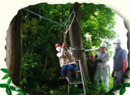
ターザンロープをシューっと！