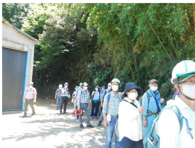
ヤマトミクリの里目指して移動