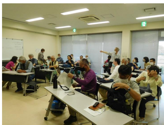
意見交換で様々な立場の意見が出た