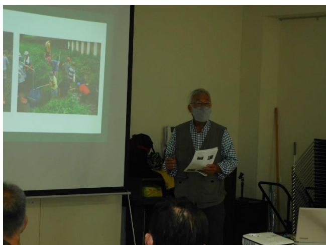
八千代オikos金室さん