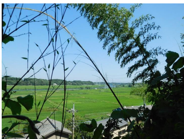
谷津の台地から見た田園風景