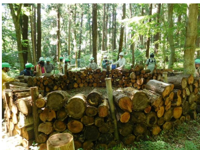
大規模なバイオネスト