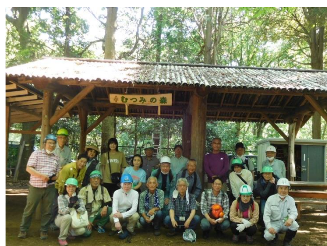
全員集合の記念写真