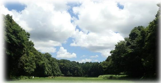
堂谷津の里（千葉市若葉区）

資源循環の視点から、これからの里山の保全、整備及び活用に関する活動（里山活動）をどのように発展させられるのか、里山活動に取り組んでいるみなさまと一緒に考える講習会です。第1部としてオンラインセミナーを、第2部として薪作りの現場を見学・体験する場をご用意しました。