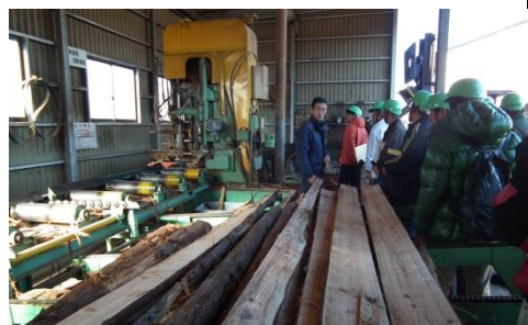
木を切っておが屑をつくる