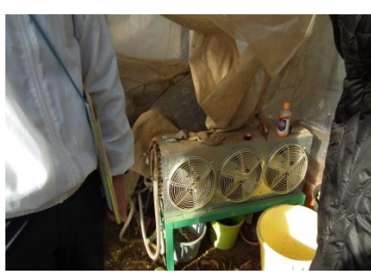
ハウス内の温風出口