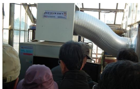
緑海園芸ハウス横の設備