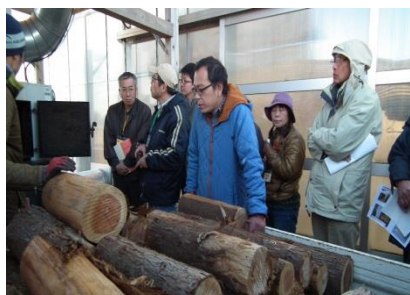
1メートルの長さの丸太投入