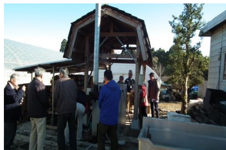
たがやす倶楽部の炉