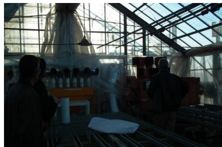
ハウス内の温風排気ダクト