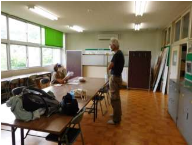
ソーシャルディスタンスを保った受付