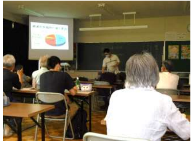
絶滅危惧植物の減少要因