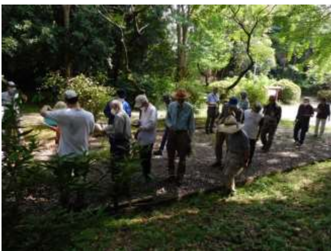
モニタリング日陰調査中