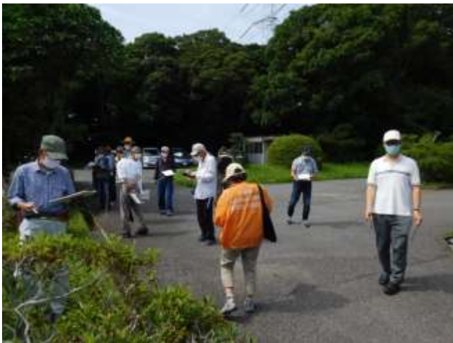
モニタリング駐車場調査中