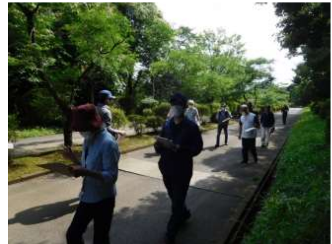
モニタリング道路際調査中