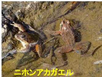
ニホンアカガエル