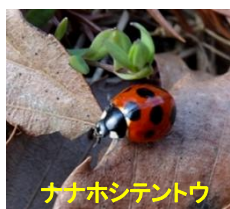
ナナホシテントウ