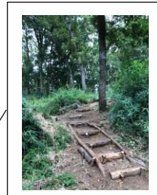
コナラ広場への散策路