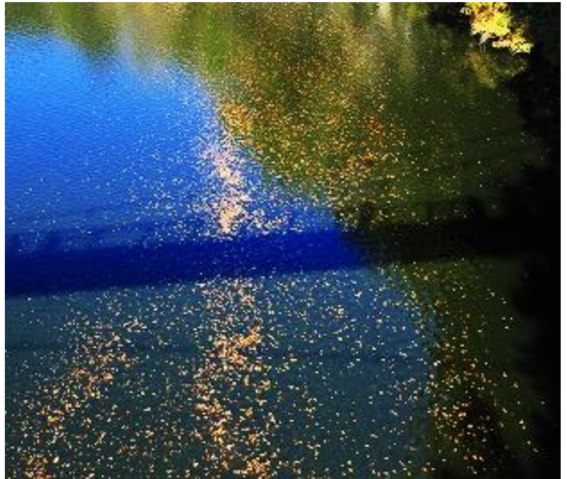
豊英湖に輝くイルミネーション？

帰りがけには光線の方向が変わった所為か平凡な風景でしたから、午前中の一瞬の輝きだったようです。(坂本)