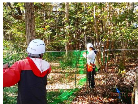
新しい植生保護柵は強度もありスツクリ

なお、今回は地下茎の延伸や種子散布を期待して既存ネットに隣接して設置しました。今後どのように植生が回復していくのかに注視したいと思います。次はホコラ山付近に、独立したエリアで設置したいと思います。(伊藤)