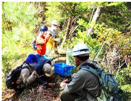
禁断の岬で何を熱心に観察・撮影？