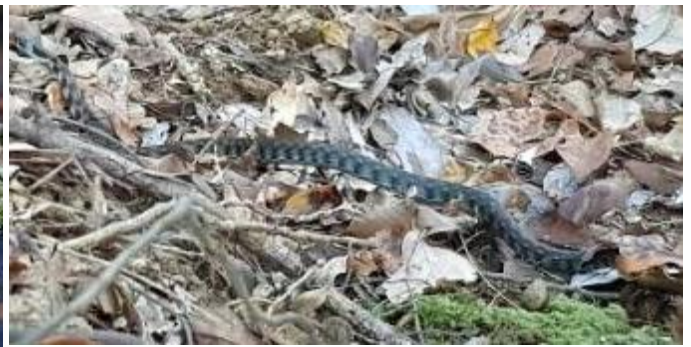
Rhabdophis cf. tigrinus