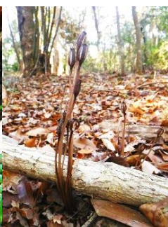
クロヤツシロラン(蒴果)