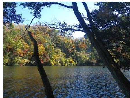
ホテイ岬から見る秋景色