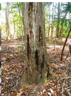
カシナガキイムシの穿入