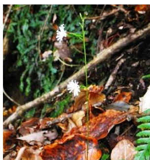
キッコウハグマ(花)