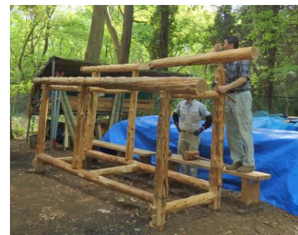
立派な薪小屋に利用 「里山むつみ隊」