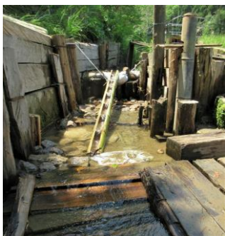
半割板を使用し水路の土留 「いちはら里山クラブ」