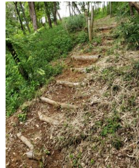
散策路の階段作り 「椎の森里山会」