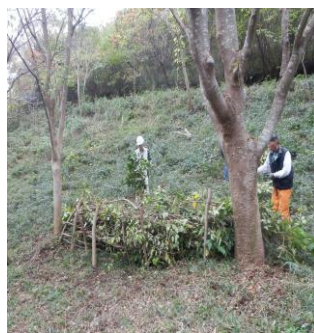
バイオネストを作る 「FIC の森」