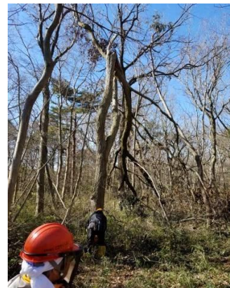
幹の途中折れの伐木 「豊富どんぐりの森」

令和元年9月9日に千葉県に上陸し甚大な被害をもたらした台風15号による風倒木は今、どのように処理されて、またどのように利用されているのかを、ちば里山センター会員74団体にアンケートをお願いし、25の団体より回答を得ることが出来ました。