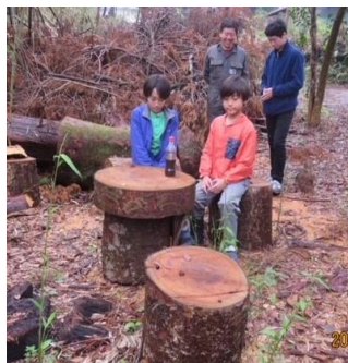
テーブルと椅子に変身 「里山エネルギー」