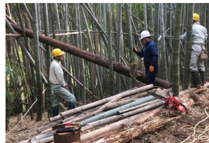
倒木で宙づりになった杉の伐木 「いちはら里山クラブ」