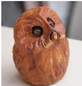
カービングでふくろう 「里山エネルギー」