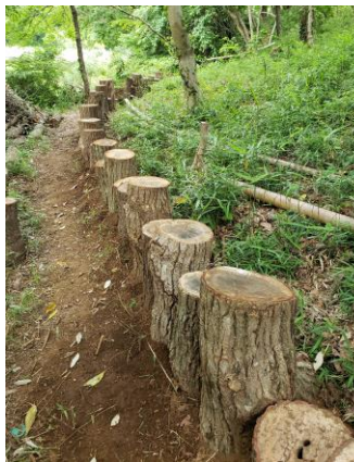
貴重植物保護の囲いに利用 「椎の森里山会」

一方、伐木処理した木材の利用は薪燃料に使用(8団体)が最も多く、一般社団法人もりびとでは花卉生産者の温室の暖房機用として納品しているそうです。その他、シイタケのホダ木(4団体)、バイオネストに利用(2団体)、散策路の整備・囲い(4団体)、薪置き場、遊具、テーブル、カービングといったところです。今回アンケートを取ってみて感じたことは台風がもたらした倒木は、見方によってはゴミかもしれませんが、直径40cm以上の大木が土に還るには10年以上の歳月が必要かと思われます。これを有効に利用することにより、利益を生み、里山景観を保全するという大切な資源となります。市原 SaToYaMa よくし隊の『廃棄は原則しない。発生から処分までを自己完結処理としている、自分たちのフィールドで起こった問題は自フィールド内で完結する』という言葉が響いてきます。