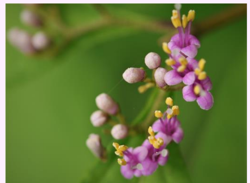
ムラサキシキブ&lt;紫式部&gt;シソ科ムラサキシキブ属

ムラサキシキブといえば9~11月頃紫の実を思い浮かべるようですが梅雨の時期に咲く花も可憐で風情があると思いませんか、紫の実がムラサキシキブの場合はまばらに付き、盛り上がりに変異が見られますが葉の付け根あたりに規則的に付くのはコムラサキという園芸種です。