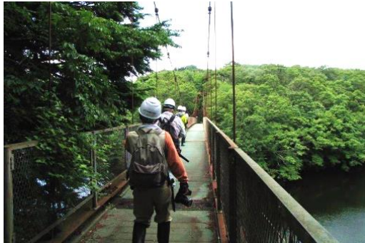
久しぶりに千年の森に向かう

ると次の作業が見えてきて、なかなか終わりが見えません。予期せぬ台風で明るくなった森を、今度どのような方針で管理するのか、数多くの議論が必要です。