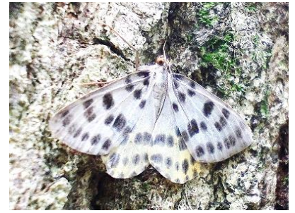
ヒョウモンエダシャク

した。ホタルガ(食草ヒサカキ)は黒い翅に白い線があり、飛ぶとよく目立ちます。蛍に見えるかな？