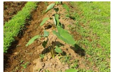
里芋は元気に育つ