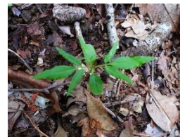
カラスザンショウ