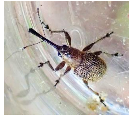
ハイロチョッキリ

甲虫で、どんぐりに産卵して、木の枝をチョッキリと切り落とします。スパッと切れたどんぐり付きの小枝が落ちていたら、この虫の仕業かもしれません。小さな体で大きな仕事をするものですね。