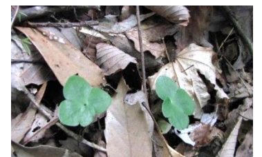
ほこら山北斜面のスハマソウ