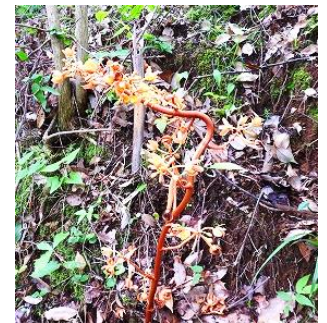
吊り橋終端に開花した首曲がりツチアケビ