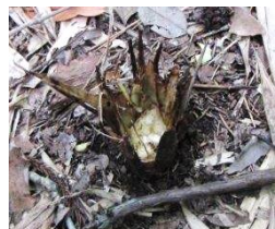
マダケタケノコの食害

調査は、島内を7コースに分かれて一斉に踏査し、発見したニホンジカを記録するといういつもの方法で実施しました。調査時間は10:00~10:30です。結果は、ニホンジカの発見はなし。痕跡としては、比較