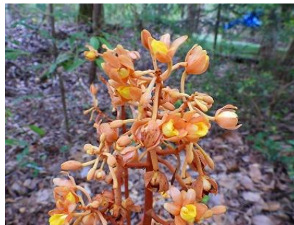
千年広場南に開花したツチアケビ

千年広場南側の5株は6株となり、5株は元気よく花が咲き1株は上の方から20cm程度までが黒ずんで花芽も黒くなっていました。黒くなった下の花はきれいに咲いていました。吊橋終端西側の1株は5月に金網柵を設置しましたが設置金網の内空高が足らなかったようです。真直ぐに伸びられず曲がっていました。花は元気に咲いていました。