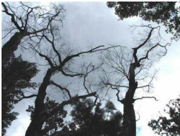
ナラ枯れで枯死したコナラ