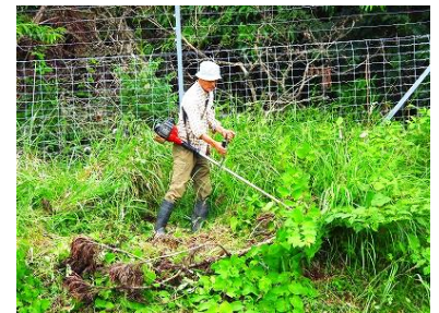
電柵下斜面の刈り払い