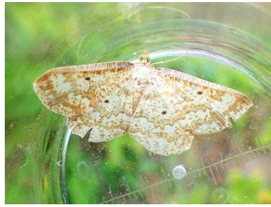
ハグルマエダシャク