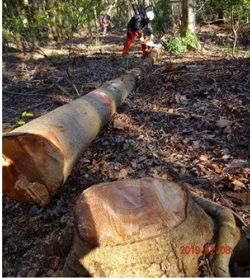
伐採木の樹齢は約60年