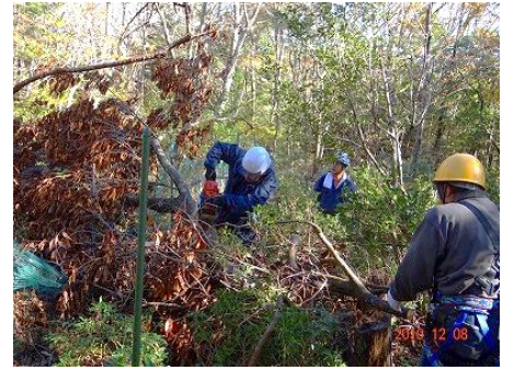
ヒメコマツ保護柵の倒木除去

まずヒメコマツ保護区の防護柵に倒れ掛かっていた樹木を処理し、次に利用頻度の多い通路沿いの支障木の伐採や除去作業をすすめました。倒れて重なり合った幹や枝は伐採時にどう動くか予想が難しく慎重な作業となりました。台風から4回目の作業になりますが、今だ着手できない大径木も多数あり、復旧までには1年以上かかりそうです。安全第一で作業を続けるとともに、通行止め、立ち入り禁止も併用して、安全を確保していきます。(伊藤)