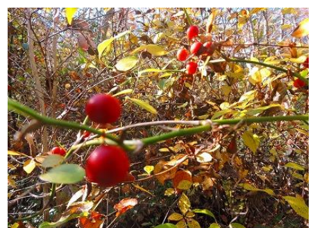
サルトリイバラの実