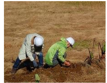
雨後の水溜まり畑の里芋堀り

品種は「唐の芋」と言い、以前に地元の直売所で種芋を買い、それ以来自家採種で作り続けているものです。一般的な品種（土垂れ）より引き締まった食感で子芋だけでなく親芋も食べられるのが特徴です。（坂本）