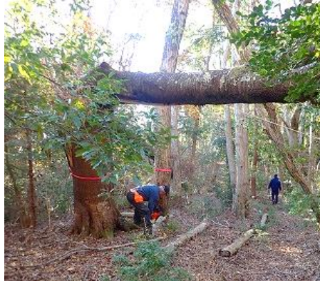
折れて重なり合った大木の伐採