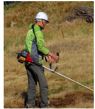
広い農地の草刈り

車は通行しやすくなりましたが、農地は広いので殆ど手付かずです。又、駐車スペースの空き地に凸部分があり、うっかり乗り上げると車体下部をこするのでこれも平らに均しました。