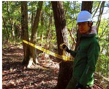
危険区域には立ち入り禁止の黄色テープ