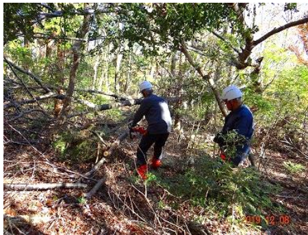
林床に散乱する倒木や枝も集めて