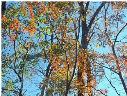
色づいたイロハモミジ