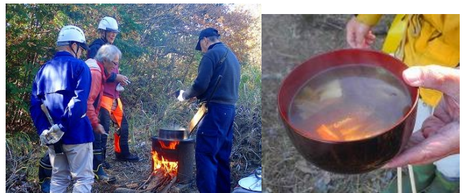
具沢山の美味しい、熱々のスープをお腹いっぱいいただきました

今年から島外に開設したの付属農園で、乾燥させておいた各地の、アカヤマドリとヤマドリタケモドキ、アラゲキクラゲ、ナラタケ、シイタケなどのきのこ類を入れ、更にベーコンと白菜を加えたので、出汁たっぷりの誰にも真似を出来ない、複雑な味のコンソメスープをつくりました。この日は、二ホンジカ調査や倒木撤去処理、