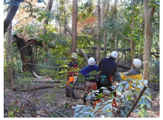
牽引班と声かけあって