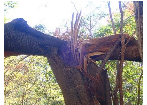
今後に残る大きな難題