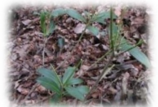
食害を受けたミヤマシキミ