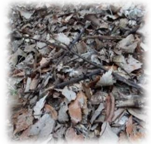
ツチアケビの残骸 1月20日