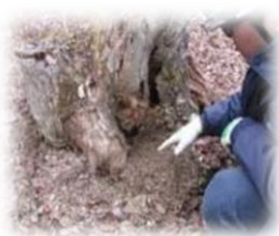
腐った切り株の根元を掘った跡