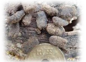
切り株の根元に落ちていた糞