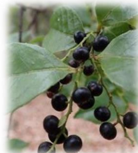
シャシャンボの実(栗山 12月)