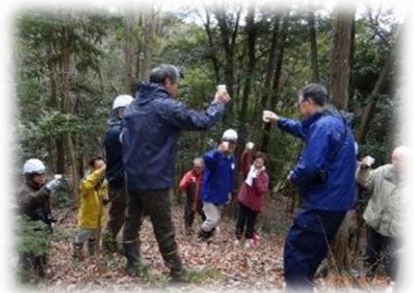
お供えの「梅一輪」で安全祈願の乾杯