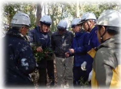
サカキ(榊)かヒサカキか同定