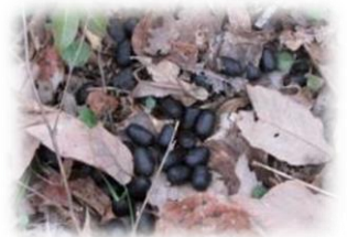
フレッシュなシカのフン

これからも油断はできませんね。植生を保護するためには、もっと丈夫なネットに交換する必要があるかもしれません。