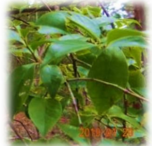
実のないシャシャンボ(1月)