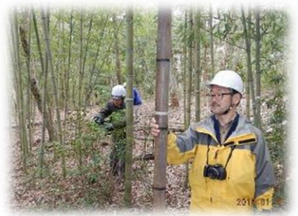
13年目で枯れたマダケ地上部

今回初めて2006年発生竹10本のうち3本が枯れていた。発生から13年目で枯れはじめたことになる。なんでもネット検索する時代だが、継続観察して自分の目で確認する面白さを実感した。(伊藤)