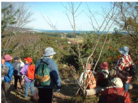
見晴らし台では太平洋が見えます。