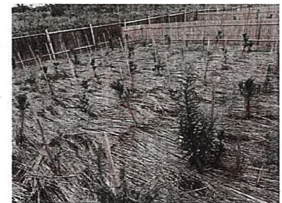
雑草があまり生えていない箇所 こういった様子のところが比較的多い (参考:竹支柱の場所に苗木がある)