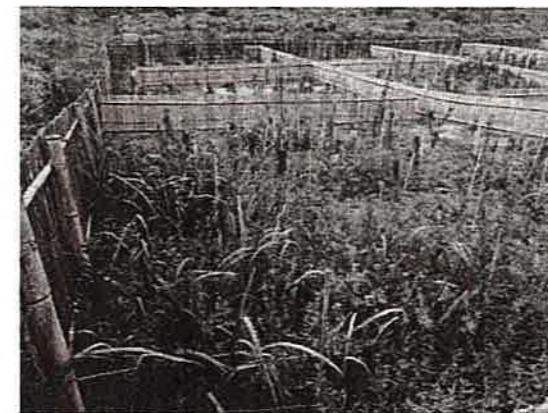
雑草が苗木を越えて生えている箇所も部分的にあるが、割合は少ない