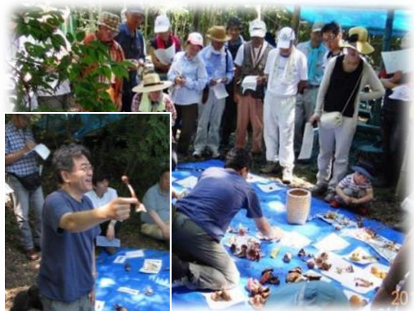
きのこ同定と吹春講師の解説