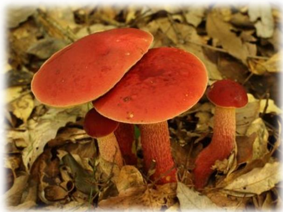
豊英島夏の名物ベニイグチ