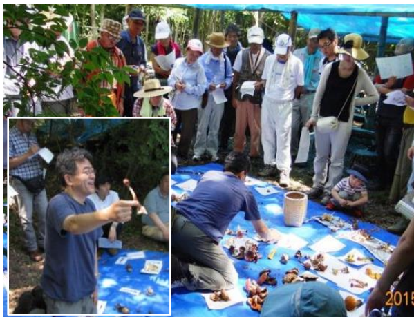
きのこ同定と吹春講師の解説