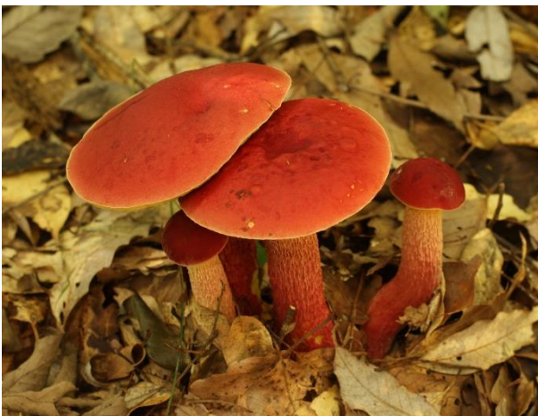
豊英島夏の名物ベニイグチ