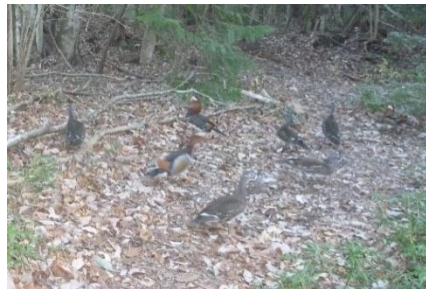
オシドリ8羽 1月2日 16:41

1月2日にオシドリ8羽が写っていました。鴨の仲間のオシドリが上陸して林内を歩いているのは不自然に見えるかも知れませんが、地上で