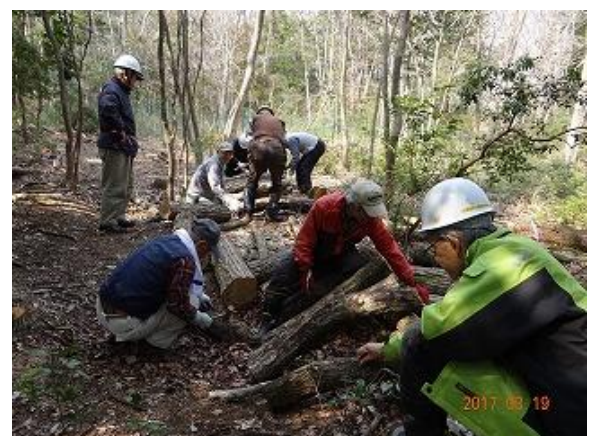
電動ドリルの快音と駒打ち小槌の音小気味良く

玉切りしたコナラのホダ木90本に植菌をする作業は、伊藤さん提供の強力なドリルで穴あけしたのち、皆さんで駒打ちをしました。駒打ちの小槌の音がコンコンと快く森に響いていました。種菌は「にく丸」でおよそ1700駒を植菌、日陰に仮伏せして菌の活着を待ち後に本伏せを行います。重いホダ木運びお疲れ様でした。(根本)