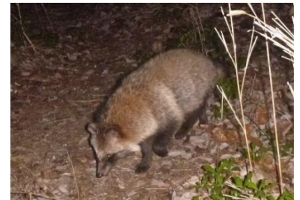
タヌキ 2月22日 20:04

なので、いわば森の鴨です。茂った樹木の間を縫って飛ぶのも巧です。どちらかと言えば水面は休息場所に過ぎないかも知れません。2月22日のタヌキの画像は丸々と太っていて、毛艶も良くいかにも冬のタヌキです。