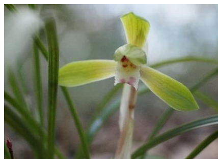
シュンランは花盛り

シュンラン盛り、アシビは盛りの時期ですが今年は極端に花付が悪く、マメザクラは蕾がほころび始めでしたから19日は3分咲きぐらいでしょう。ホテイ岬の先端にたくさん蕾を付けた株があります。