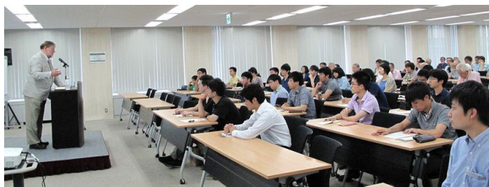
目も耳もニコル氏に集中