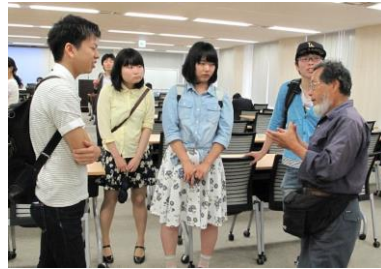
里山活動の先輩に尋ねる