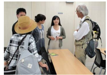
フィールドはどこですか？