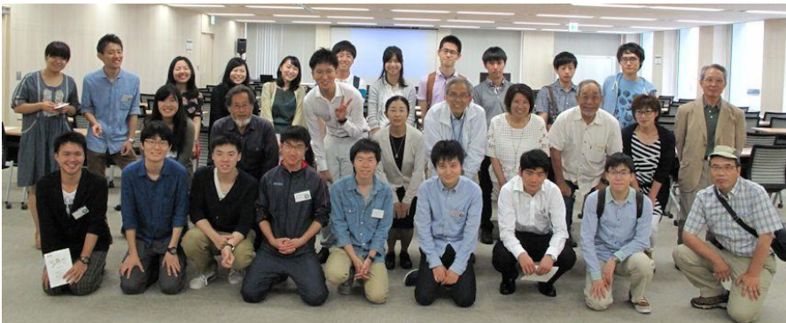
学生スタッフ・里山センタースタッフ集合