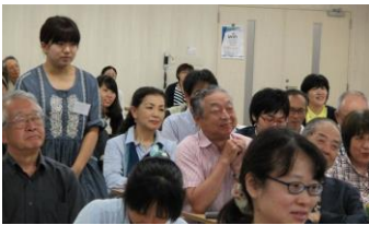
質問者へマイクを運びます