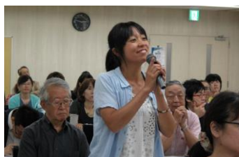
若い世代から質問