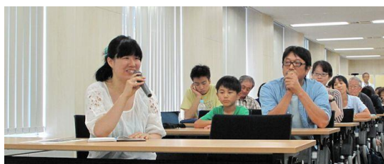
教壇を目指す学生から質問