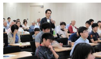
森の楽しさを子どもに どう伝える？