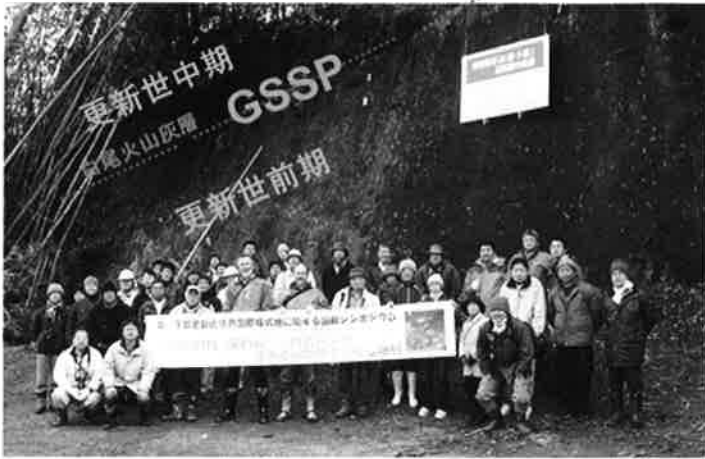
▲養老川沿いの地質時代境界の国際模式候補地の崖