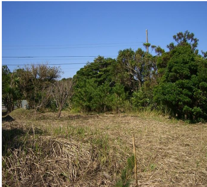
↑ 高村智恵子の住居跡