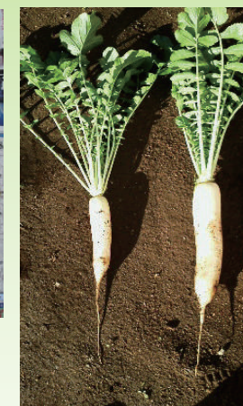
落花生・大根（それぞれ右が竹炭使用）