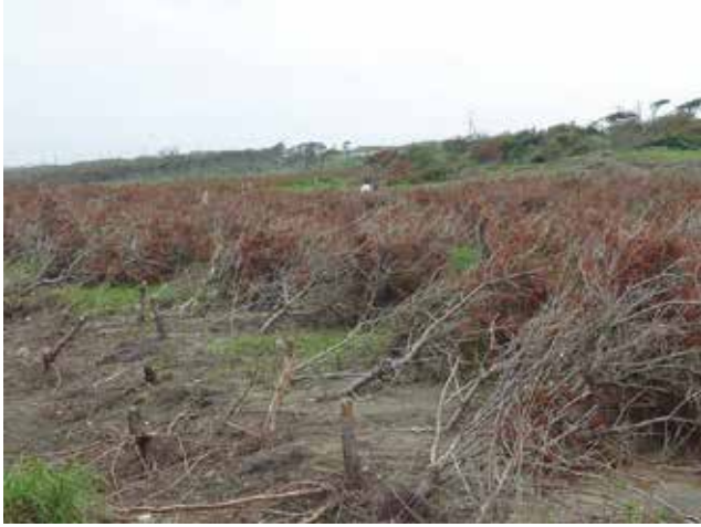
被災直後の海岸林