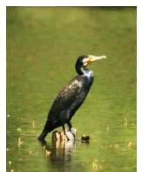
カワウ 7/20 坂本

キジバト囀り カワウ 3 トビ 1+声 ハシブトガラス声 ヒヨドリ 1+声 ウグイス囀り メジロ囀り カワラヒワ囀り ホオジロ囀り (坂本)