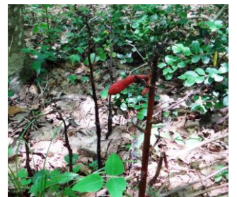
実 1 個残るツチアケビ 7/20 真鍋