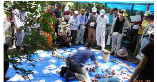
キノコ講義は次第に熱を帯び、皆熱心に聴き入りました