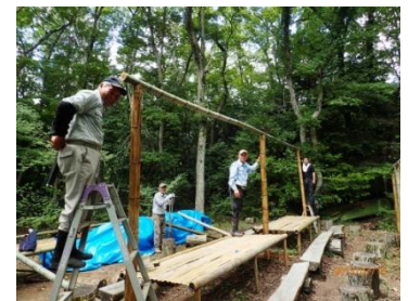
柱は頑丈な孟宗竹

(危険木処理) ホコラ山上り口の朽ちた桜の伐倒と、前回ホコラの後ろで、宙ぶらりんになっていた掛かり木を一本処理しました。(根本)