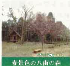
春景色の八街の森