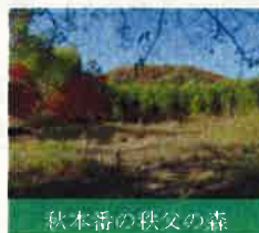
秋本番の秩父の森