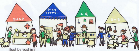
illust by yoshimi

手作り作品をとおして人と人、 人と自然の「つながりを大切に・・・」 いろいろと体験が楽しめます。