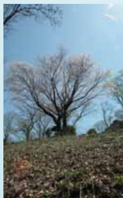
行人塚のシンボルツリー