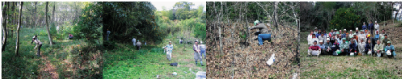
11/6 千葉市谷当町 「入門森づくりの実践」 11/21 和田町 「里山の達人と一緒に森づくり」 2/27 和田町 「続・里山の達人と一緒に森づくり」