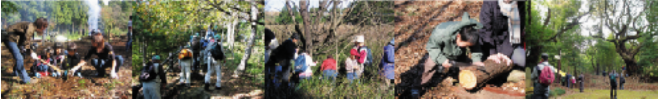
11/3 千葉市谷当町 「秋の里山で植樹体験」 11/23 君津市清和県民の森 「晩秋の里山で健康づくり」 12/5 千葉市下大和田 「初冬の里山で自然観察とクラフト制作」 2/5 船橋市 「早春の里山で子供のための体験教室」 3/6 八日市場市 「春の里山で森の古道散策」