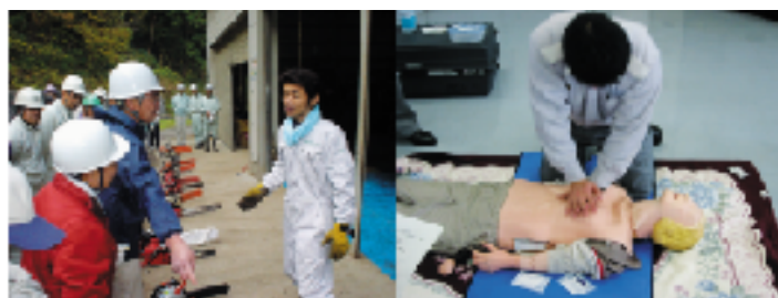
11/25-26 富津市 「チェンソーの安全研修」 2/20 袖ヶ浦市 「救急への対処法」

◆救急への対処法◆ 救急時には応急処置も大切ですが、救急車が出るだけ早く現場に到着できることも重要です。そのため通報時に作業場所を説明できるよう、 普段から住所や目標物などを確認 しておきましょう。また山中の現場は見つけにくいので、わかりやすいところまで 救急車を誘導 に出しましょう。 (ホームページのイベント報告「救急への対処法」より抜粋加工)