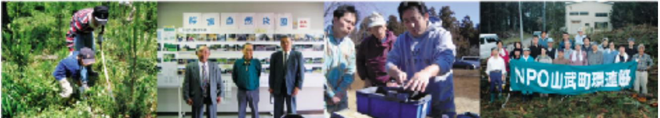
10/23 成田市 「実践森の手入れ・下刈り」 11/7 多古町 「賢い情報の発し方」 2/11 神崎町 「プロに教わる刃物の研ぎ方」 3/12 山武町 「プロに教わる刃物研修と植樹行事」