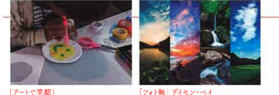
「アートで笑顔」 「フォト軸」デモン・ベイ

場所 長生郡長南町笠森302 / 鑑賞パスポート提示で拝観料半額 / 国指定重要文化財 / 日本唯一の「四方懸造」