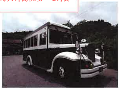
ボンネットバス運行 C系統(牛久～内田～笠森観音ルート)で運行