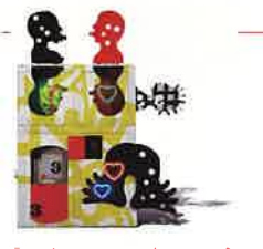
「Favela Brasil Series」ジョゼ・デ・ギマランイス / 2010

場所 市原市不入75-1 / 一般1,000円[800円]、大高生・シニア800円[600円]、中学生以下無料 / 鑑賞パスポート提示で団体料金( )表記 / ぱっちゃんラリー 作品展示 「ジョゼ・デ・ギマランイス展 ～アフリカは魅了する～」 / 10月20日-1月14日 / ポルトガルの国民的作家ギマランイスのビッドな色使いの作品のほか、作家のアフリカン・アート・コレクションを展示。 イベント 「ポルトガル・デイ」 / ポルトガル文化を感じられるイベントやワークショップを開催 / 11月23日-25日 ランチ情報 房総の食材を使ったピザが楽しめるレストラン「PIZZERIA BOSSO」が営業 / 平日 11:00-20:00(L.O 19:00)、土日祝日 11:00-21:00(L.O 20:00)、月休