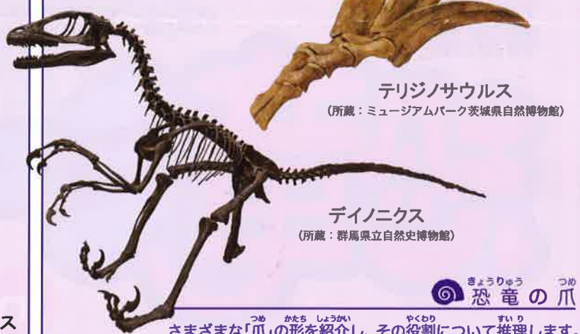
テリジノサウルス (所蔵：ミュージアムパーク茨城県自然博物館)