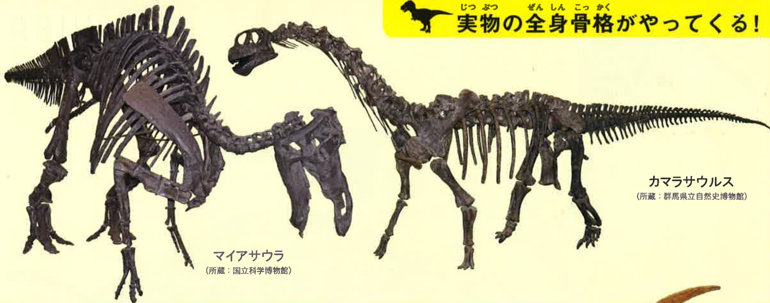
マイアサウラ (所蔵：国立科学博物館)