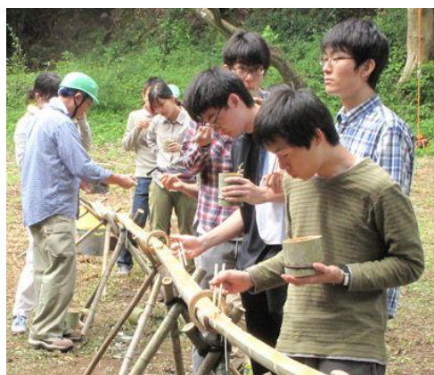
そうめんを擀う学生の皆さん