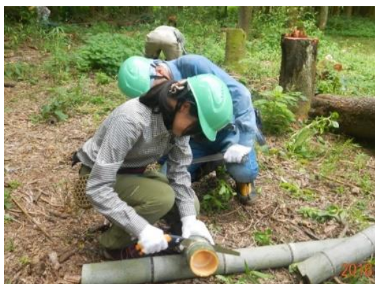
食器は各自の手作り