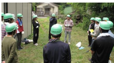
学生班整備の基本を学ぶ