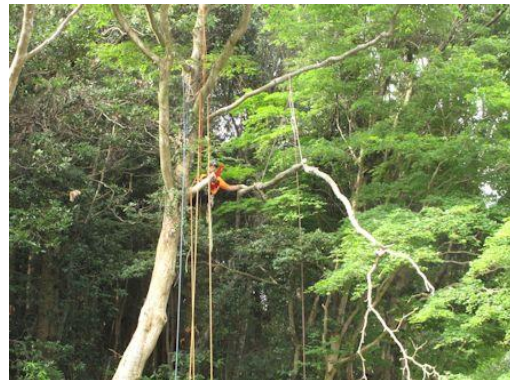
空中で枯れ枝を伐採