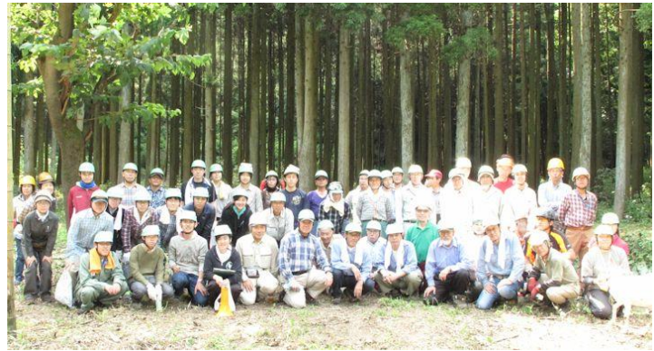
整備後の集合写真