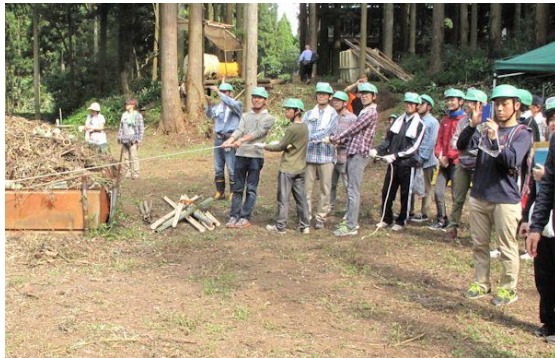
ロープを引っ張る