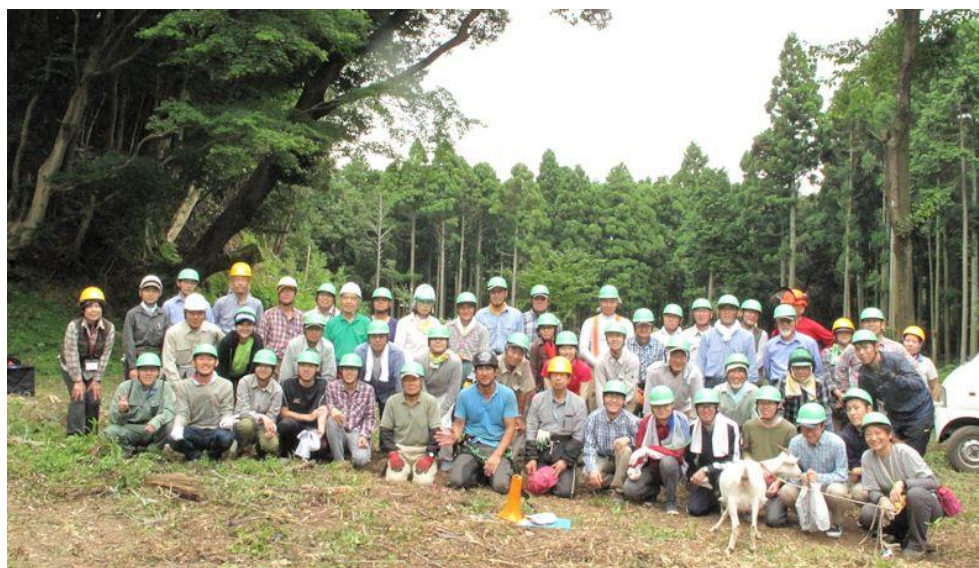
作業前の集合写真