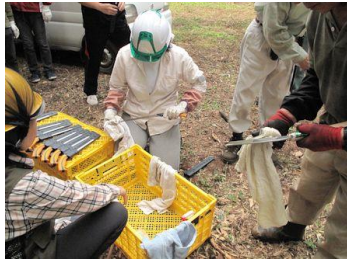
ノコギリの清掃・整備