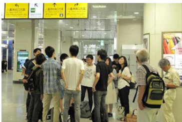
東京駅八重洲口に集合