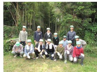
整備した森をバックに（学生班）