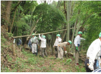
竹林整備（社会人班）