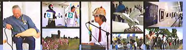
鳥のことをよく知っていてもいなくても、大人から子どもまで楽しめるイベントです!!