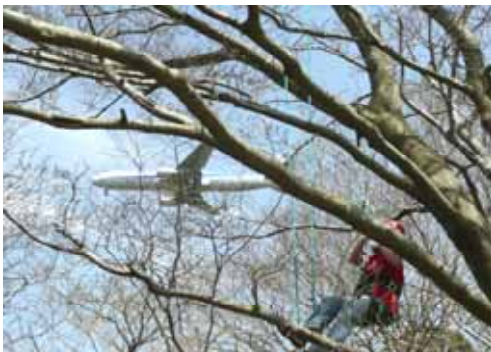
成田空港近くの公園での体験会